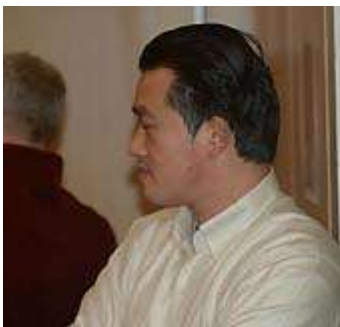
Cai gaf zijn persoonlijke verhaal