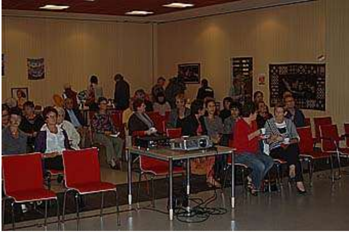
De zaal stroomt langzaam vol

22.00 - 23.00 uur Vragen rondje en gezellig samenzijn met traditionele muziek