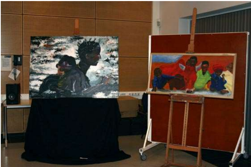
Kunstwerken van Jeroen Bax