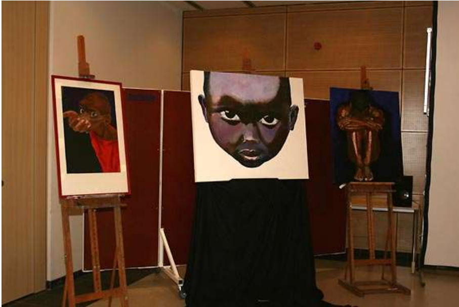
Kunstwerken van Jeroen Bax