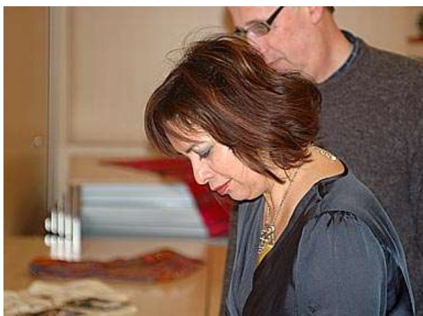
Margarita met man en zoon